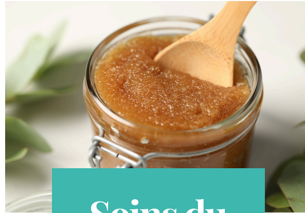
Soins du Corps