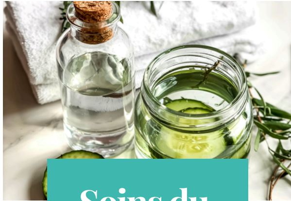
Soins du Visage